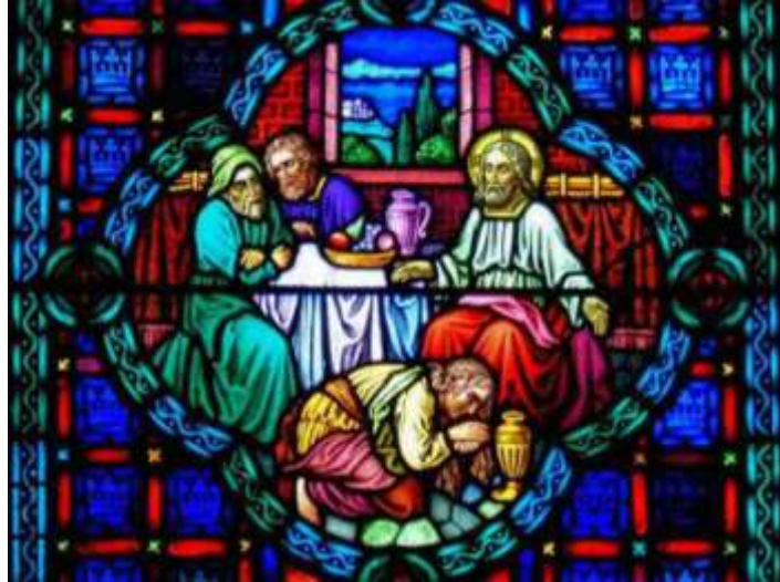
Vitrail de Saint Patrick USA