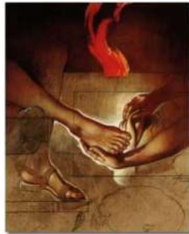
FERRO Lavement du pied