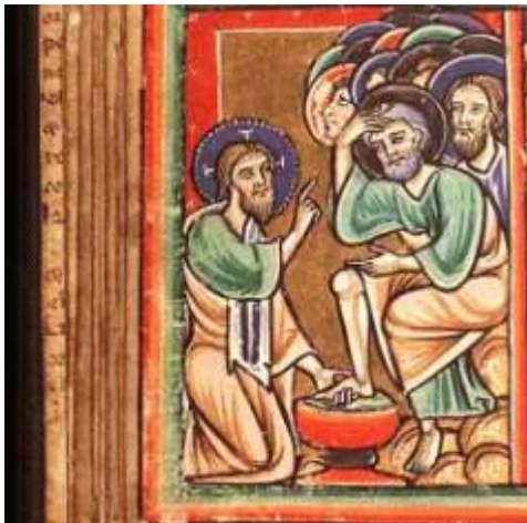
Auteur inconnu Bible illustrée avec des miniatures du Nord Ouest de la France (vers 12 ème siècle)