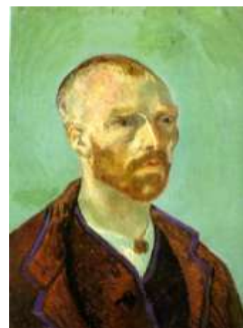
Van Gogh, Autoportrait