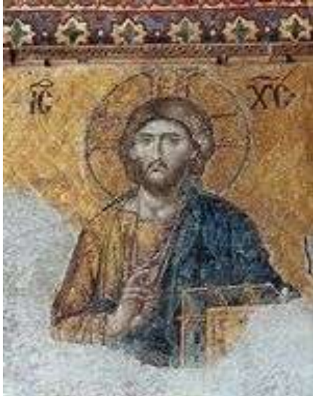
Christ Pantocrator d'Istanbul